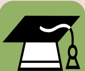
滋賀県立大学 参加23名

4年ぶりにPTA研修旅行をおこないました。2コースの大学見学と体験研修などで親睦を深め、それぞれ有意義で楽しい秋の一日となりました。