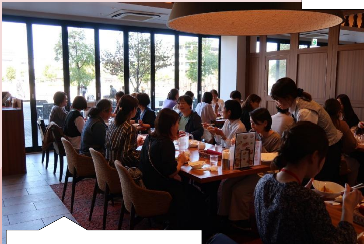
校内の素敵なレストランでランチをいただきました。