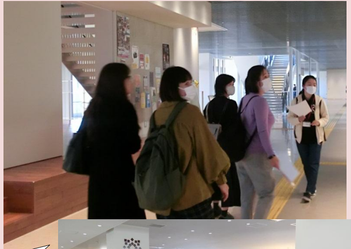
キャンパスツアー