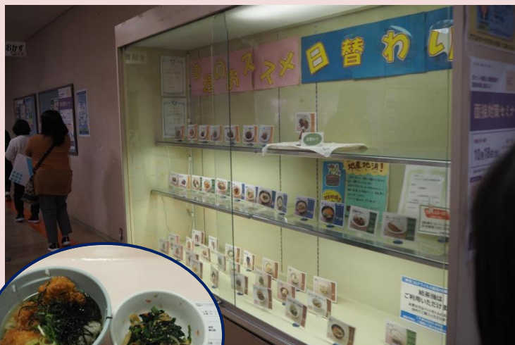
【学食】学生気分で楽しいランチタイムになりました！