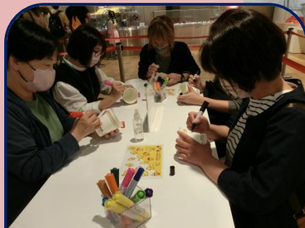
カップヌードル作りを体験しました！