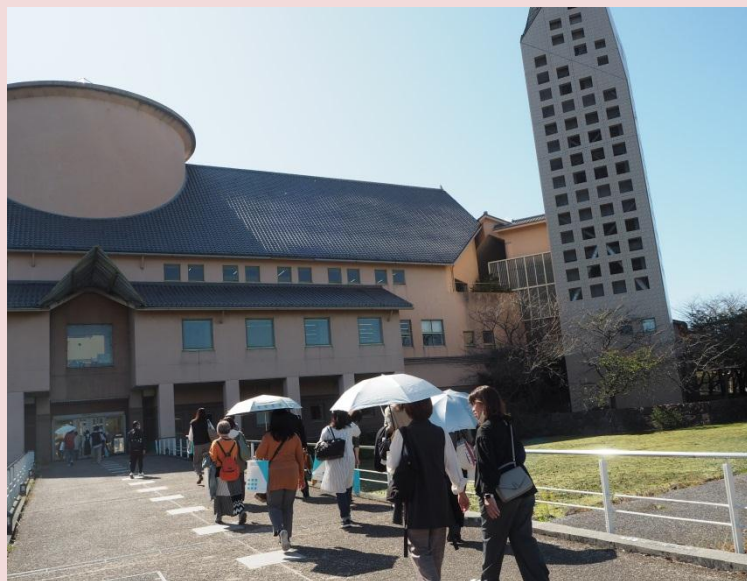
キャンパスツアー