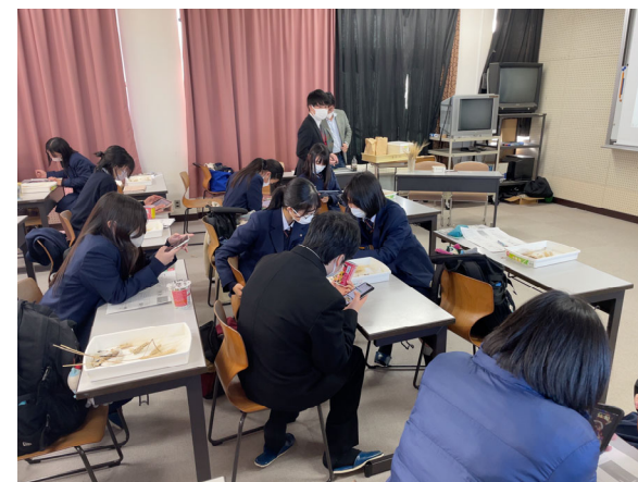
6種類のご当地ラーメンの「誕生背景」「特徴」「商品のアピールポイント」を調べ、発表しました。