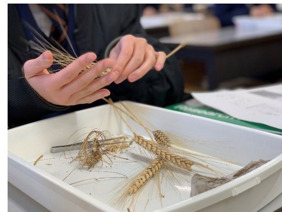
さまざまな種類の小麦を実際に手にとって見て、脱穀してみました。