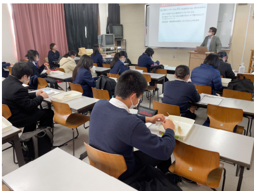
テーマは「ラーメンから見える世界～日本の「国民食」ラーメンから考える食と農～