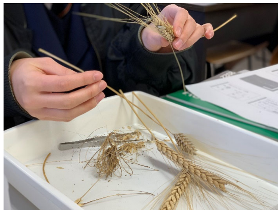
～遺伝学の観点から様々な用途で使われる小麦の進化をたどる～